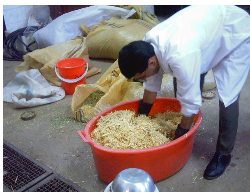
شکل ۳- عمل‌آوری و تهیه نمونه‌های کاه به شیوه رایج (در آزمایشگاه)