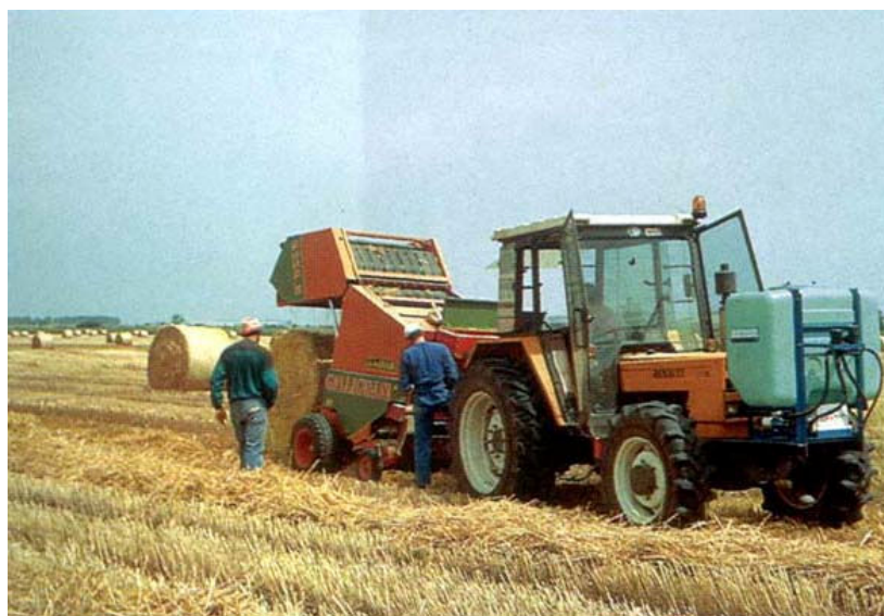
شکل ۱- عمل آوری مکانیزه بسته های کاه غلتکی با اوره در مزرعه (Chenost & Kayouli, 1997)