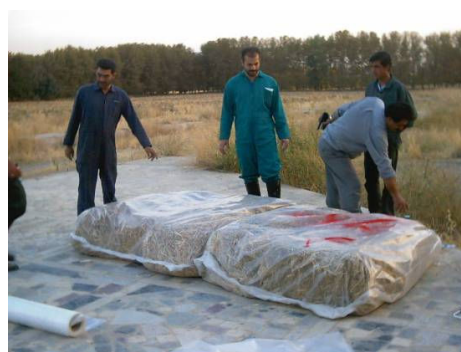
شکل ۴- قراردادن بسته‌های کاه غنی‌شده زیر پوشش پلاستیک

عرض کار کمباین (۴ متر) در نظر گرفته شد. با اتصال بسته‌بند به تراکتور مسی فرگوسن مدل ۲۸۵، میانگین تعداد بسته‌ها و وزن هر بسته کاه قابل جمع‌آوری در مسیری به طول ۱۰۰ متر (به عبارت دیگر در مساحت ۴۰۰ متر مربع (۴ × ۱۰۰ متر))، در سه تکرار اندازه‌گیری شد. سپس با استفاده از بسته‌بند بهینه‌شده و با تراکتور مذکور، زمان لازم برای تشکیل ۱۰۰ بسته کاه غنی‌شده (شامل زمان دورزدن، توقف، تنظیمات، و...)، در سه تکرار اندازه‌گیری شد. با استفاده از زمان صرف‌شده برای غنی‌سازی کاه در مساحت مورد آزمایش، سرعت پیشروی (سرعت واقعی) و در نهایت ظرفیت مزرعه‌ای دستگاه محاسبه شد. همچنین ظرفیت ماده‌ای موثر بر اساس میزان عملکرد مزرعه (کاه قابل بسته‌بندی در هر هکتار)، محاسبه شد. میانگین داده‌های به دست آمده از این تحقیق، با استفاده از نرم‌افزار SPSS و به روش S.N.K. تجزیه و مقایسه شد.