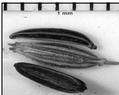
شکل ۱ - میوه کامل گیاه زیره سبز (در وسط) به همراه دو عدد پوشینه در طرفین.

نخود و ساقه‌های خشک آن به ترتیب ۳ و ۵/۵ متر بر ثانیه است. همچنین ماکزیمم ضریب اصطکاک دانه‌های نخود با سطوح فلزی و فایبرگلاس به ترتیب برابر ۰/۲۸ و ۰/۳۳ رادیان است. با استفاده از اطلاعات به دست آمده در مورد خصوصیات فیزیکی دانه نخود، دستگاه بوجاری و درجه بندی نخود نیز طراحی و ساخته شد. این دستگاه قابلیت تغییر شیب الک‌ها، نوع الک و همچنین سرعت جریان هوای بادبزنی دارد و عملکرد آن ۸۴ درصد است (Tabatabaefar et al. , 2002).